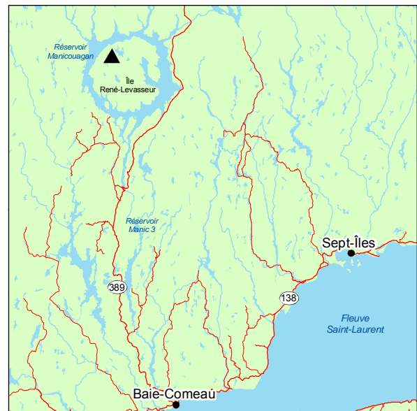
▲ Forêt ancienne du Lac-du-Grand-Poisson

La forêt ancienne du Lac-du-Grand-Poisson occupe plus particulièrement des stations où le drainage est modéré, bien que la texture du sol y soit grossière. Effectivement, le relief plutôt plat et la faible dénivellation par rapport aux lacs adjacents font en