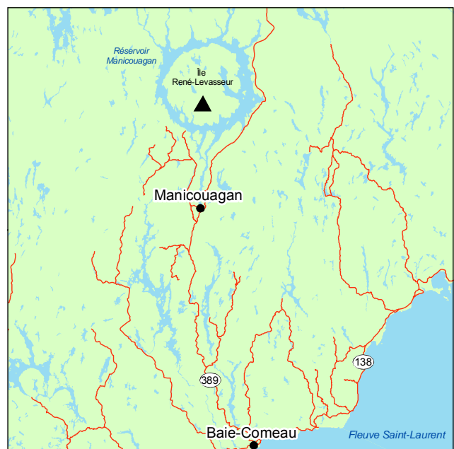
▲ Forêt ancienne du Lac-Moulé

On rencontre essentiellement deux types de groupements végétaux dans la forêt, soit la pessière noire à sapin et la sapinière à épinette noire. Ces deux groupements végétaux se différencient essentiellement par la proportion de sapins et d'épinettes noires qu'ils renferment. On considère généralement qu'une importante présence de sapins dans le peuplement témoigne d'une longue maturation, et vient renforcer son caractère ancien. Après feu, c'est l'épinette noire qui va coloniser massivement le parterre forestier, le sapin s'y installant bien plus tard. Outre le sapin et l'épinette noire en proportions variables, le couvert de la forêt renferme par endroits de l'épinette blanche et du bouleau à papier.