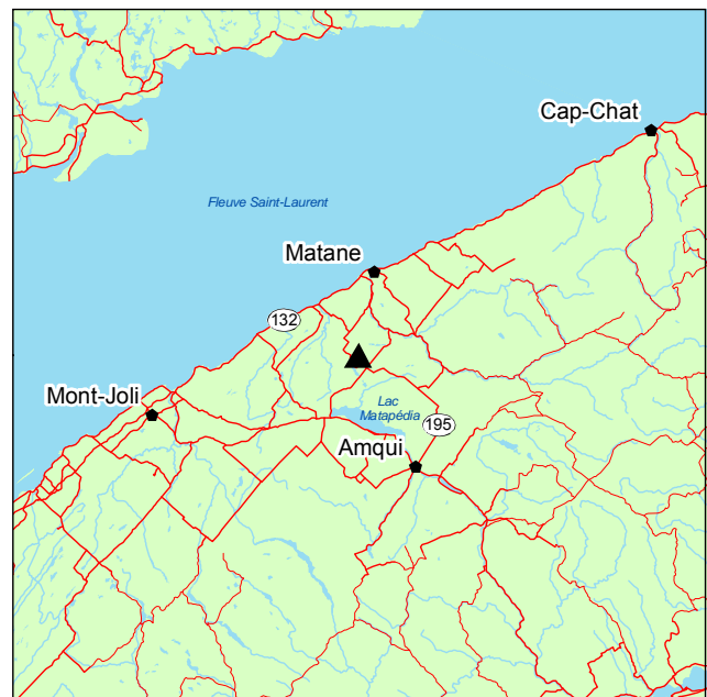
▲ Forêt ancienne de la Rivière-Petchedet-Est

Le couvert forestier de la forêt ancienne est occupé principalement par l'érable à sucre et, dans une moindre mesure, par le bouleau jaune et le sapin baumier. Les arbres atteignent 20 m de hauteur. La strate arbustive est aussi composée de l'érable à sucre, parfois accompagné de Corylus cornuta et d' Acer spicatum . Dans la strate herbacée, on note surtout Dryopteris spinulosa var. sp. et Oxalis acetosella subsp. montana .