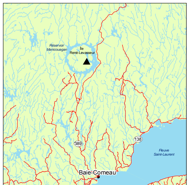
▲ Forêt ancienne de la Rivière-de-la-Clef

Au stade d'arbustes s'ajoutent Sorbus americana et Viburnum edule . Le sous-bois est dominé par les mousses Hylocomium splendens , Pleurozium schreberi et Ptilium crista-castrensis . Les herbacées