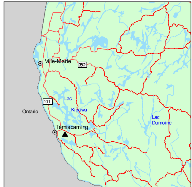
▲ Forêt ancienne du Lac-Taggart

L'étage supérieur de la forêt est dominé par le pin rouge et le pin blanc, accompagnés du thuya occidental, du sapin baumier et de l'épinette blanche. L'étage arbustif est assez diversifié et uniformément occupé par le sapin baumier, l'érable rouge, l'érable de Pennsylvanie et le bouleau jaune, auxquels s'ajoutent Corylus cornuta et Vaccinium angustifolium . Dans le parterre, la couverture herbacée n'est pas très forte, mais on note des espèces acidophiles des forêts résineuses, comme Aralia nudicaulis et Clintonia borealis , de même que des espèces préférant les parterres secs et bien ensoleillés, dont Gaultheria procumbens et Pteridium aquilinum . Quelques mousses sont présentes, notamment Bazzania trilobata .