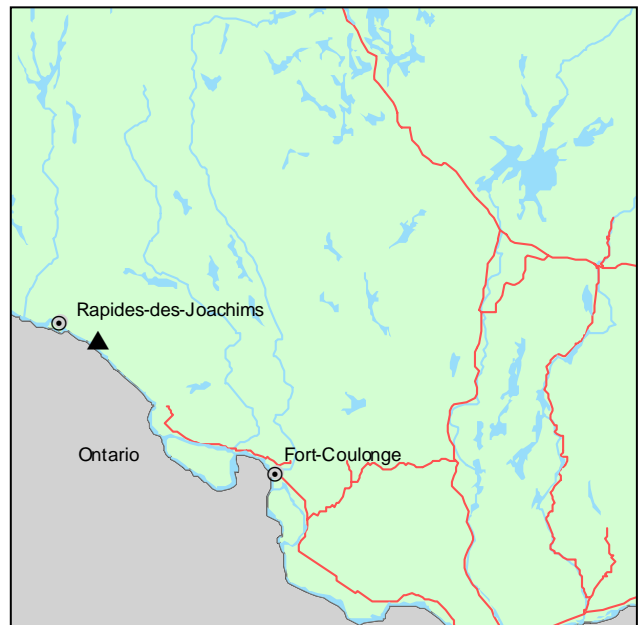
▲ Forêt refuge du Lac-à-la-Tortue

Cette forêt refuge fait partie du sous-domaine bioclimatique de l'érablière à bouleau jaune de l'Ouest. Elle se trouve à 70 km au nord-ouest de Fort-Coulonge, aux abords de la rivière des Outaouais. Elle occupe une superficie de 17 ha. Le secteur présente un relief de collines arrondies. Le roc, de nature métamorphique, affleure sur plus du tiers du territoire, particulièrement sur les sommets et les pentes.